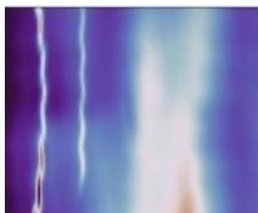
Visualisation d'impédance électrique de 2 câbles de télécommunications posés sur le fonds marins

ELWAVE est en très forte croissance depuis sa création en 2018 :